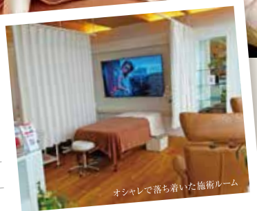
オシャレで落ち着いた施術ルーム

当サロンは機械による施術、小顔やリフトアップ、 オールハンドによる骨盤矯正とスタイルアップなどを 得意としております。